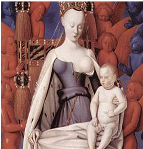
Αγνή Σορέλ. Η ερωμένη τού Γάλλου αυτοκράτορα Καρόλου Ζ. Ένα διάσημο θύμα τού υδραργύρου.

Ωστόσο με τον υδράργυρο, οι εχθροί τής Μοσκαλένκο πέτυ-