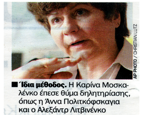
■ Ίδια μέθοδος. Η Καρίνα Μοσκαλένκο έπεσε θύμα δηλητηρίασης, όπως η Άννα Πολιτκόφσκαγια και ο Αλεξάντρ Λιτβινένκο